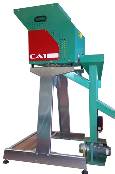
Réf. SEJ0003 → SEJ 400

Щоб зекономити час під час сортування, до кожного з них може бути підключений відповідний сортувальник шкаралупи. Пневматичний сепаратор, який може вилучати від 20% до 30% шкаралупи.