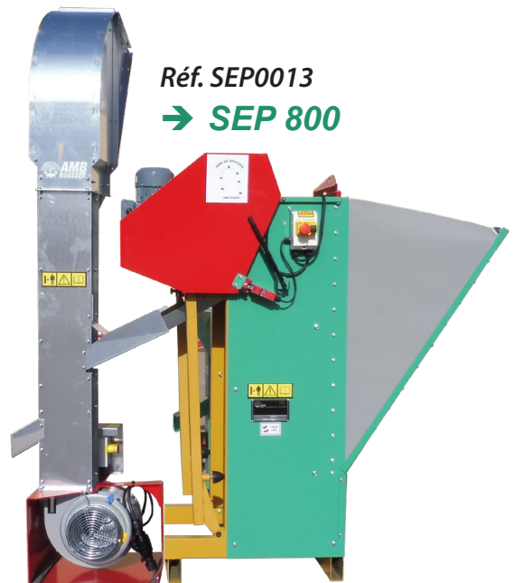
Réf. SEP0013 → SEP 800